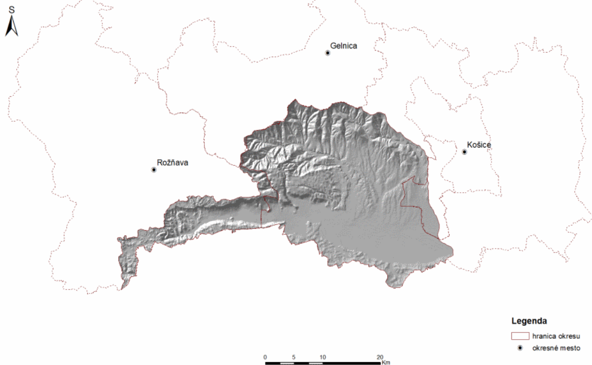
Územno-správne jednotky v čiastkovom povodí Bodvy