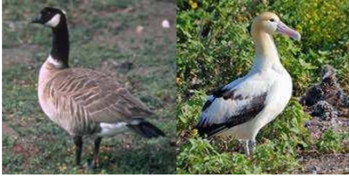
Branta canadensis leucopareia Phoebastria albatrus