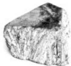
železo a oceľ