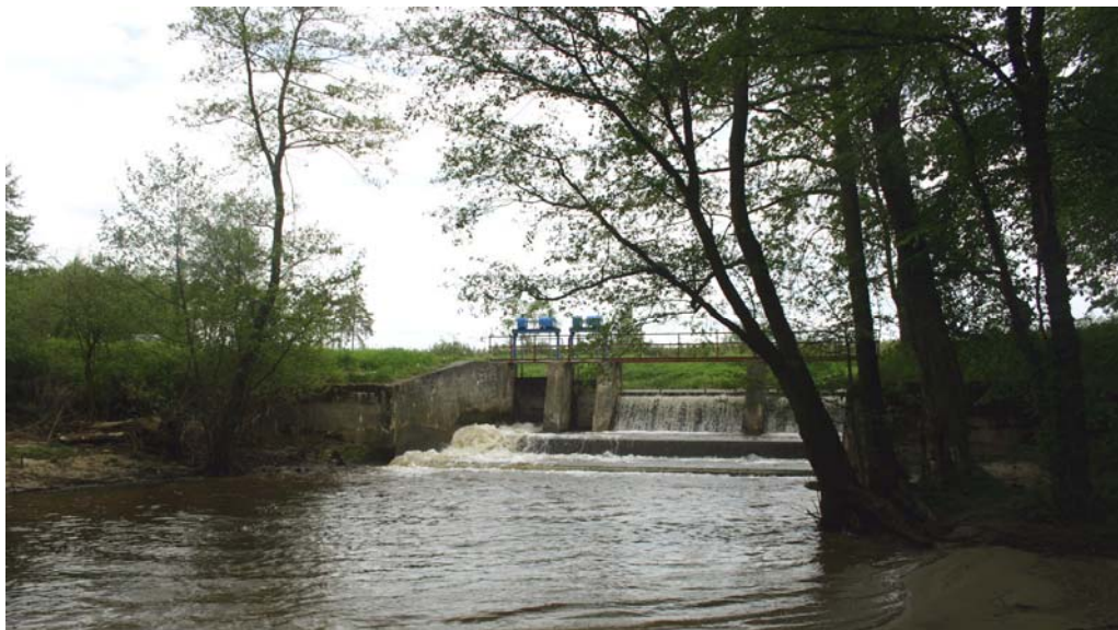
Priehrada na Rudave