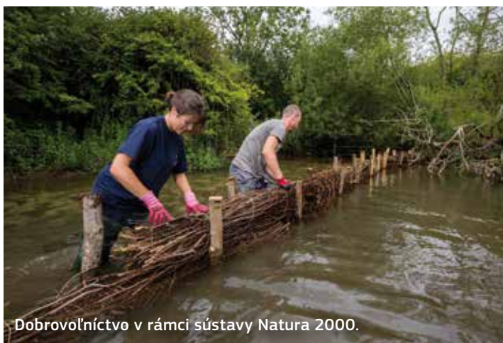
Dobrovoľníctvo v rámci sústavy Natura 2000.