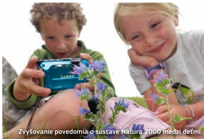
Zvyšovanie povedomia o sústave Natura 2000 medzi deťmi.