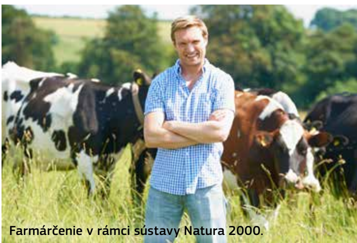
Farmárčenie v rámci sústavy Natura 2000.