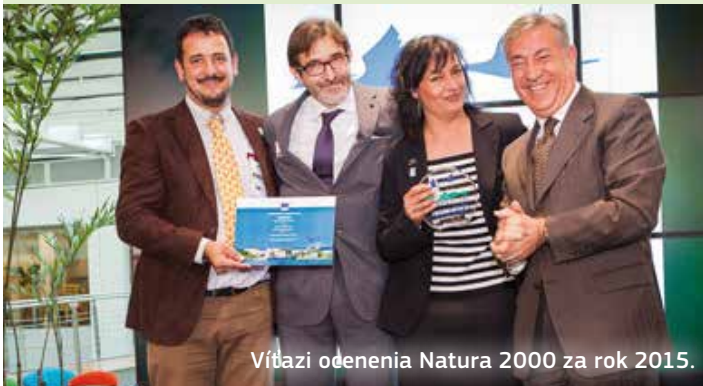
Vítazi odmenenia Natura 2000 za rok 2015.

http://ec.europa.eu/environment/nature/natura2000/awards/index_en.htm