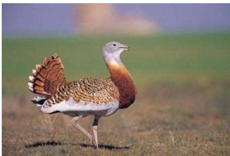
Drop veľký – Otis tarda