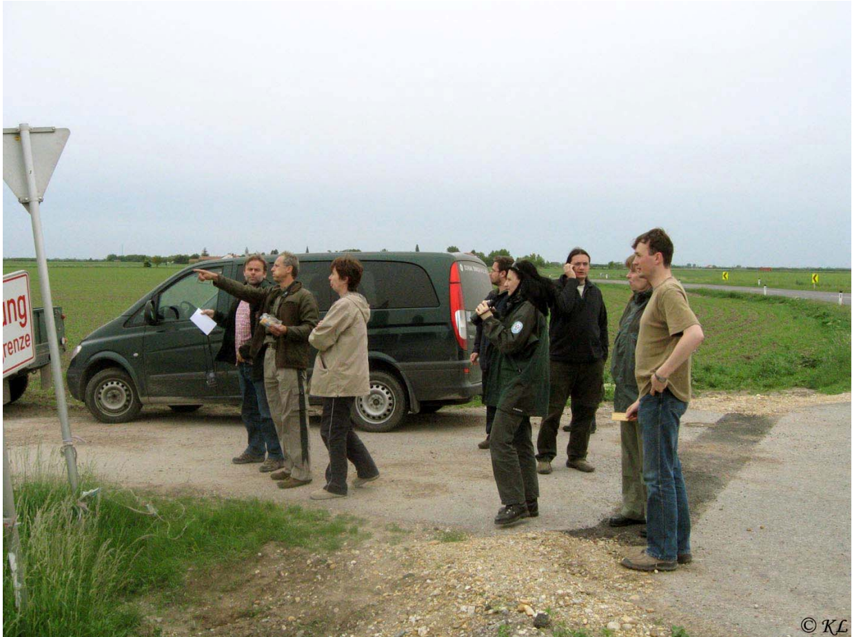
Spoločná exkurzia s rakúskymi a maďarskými partnermi