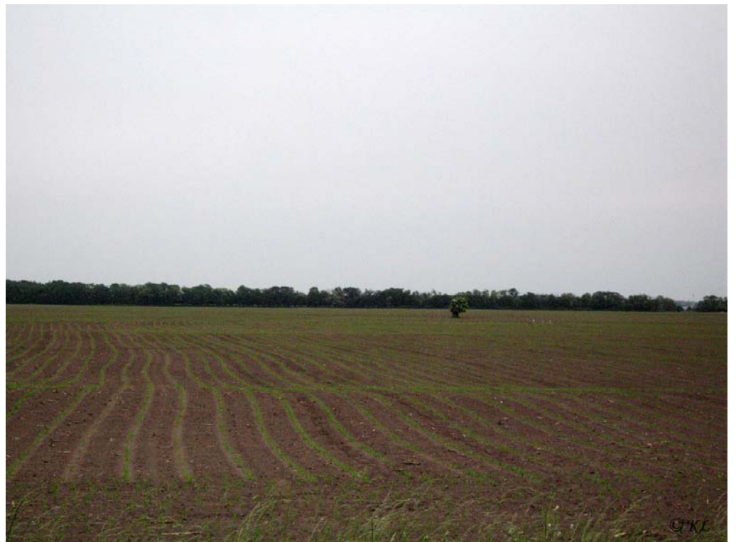
CHVÚ Sysľovské polia – v pozadí tri dropy