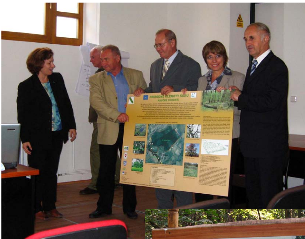
Slávnostné otvorenie náučného chodníka