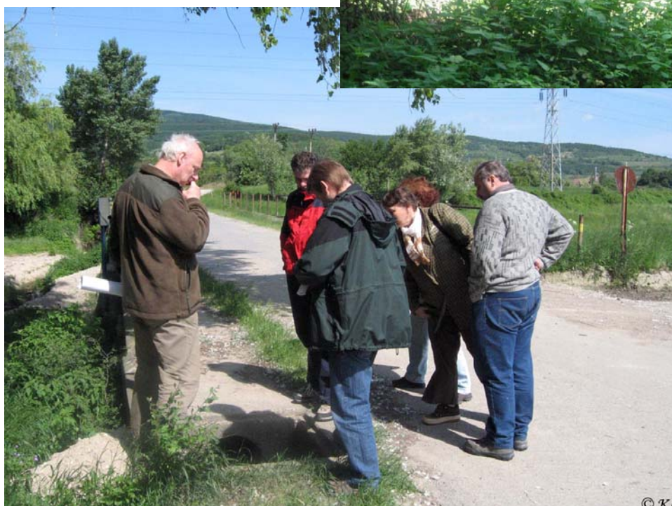
Kontrola regulačného objektu