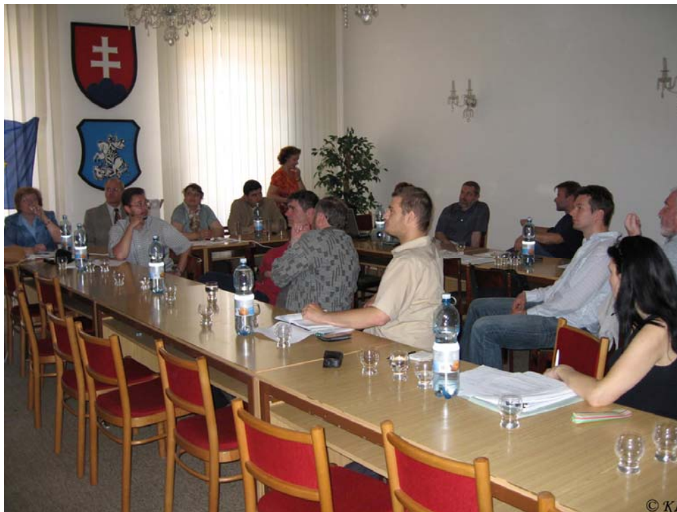
Prerokovanie štúdie EIA na MÚ vo Svätom Jure